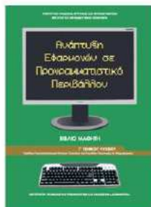
ΑΕΠΠ-Βιβλίο μαθητή [ΒΙΒΛΙΟ 1]