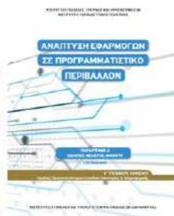
ΑΕΠΠ-οδηγίες μελέτης μαθητή 2 η έκδοση 2019 [ΒΙΒΛΙΟ 3]