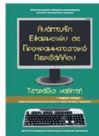
ΑΕΠΠ-ΤΕΤΡΑΔΙΟ ΜΑΘΗΤΗ [ΒΙΒΛΙΟ 4]