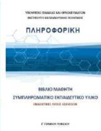
Ενδεικτικές λύσεις ασκήσεων [ΒΙΒΛΙΟ 5]