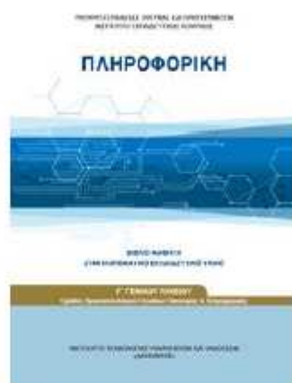
Συμπληρωματικό εκπαιδευτικό υλικό [ΒΙΒΛΙΟ 2]